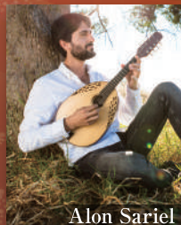
アロン・サリエル (マンドリン)